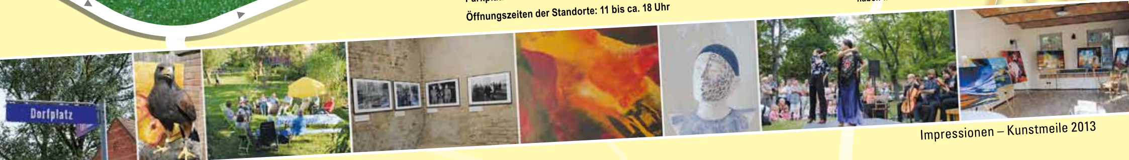
Impressionen – Kunstmeile 2013

Für Fragen rund um die Kunstmeile haben wir für Sie eine Hotline eingerichtet: ☎ 0176 - 376 22 333