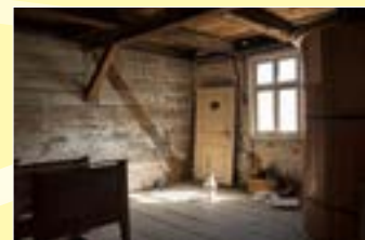
Die Historische Wassermühle Beelitz

Wir freuen uns auf Ihren Besuch und heißen Sie herzlich willkommen!